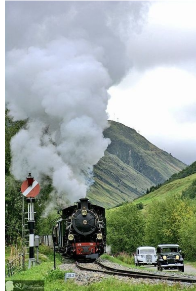
Fotofahrt 2021

... schon während der Fahrsaison gab es Schnee